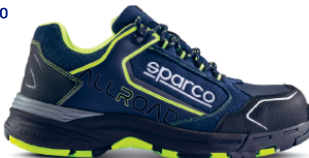
SOCHI ESD S3S SR FO HRO 07529tgBMGF