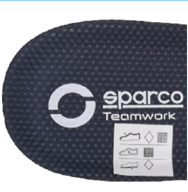
ETICHETTA COMPOSIZIONE applicata alla scarpa destra Dimensioni 28 x 28 mm