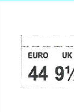
ETICHETTA TAGLIA cucito tra tomaia e linguetta Dimensioni 17 x 14 mm