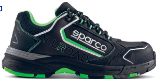
BAKU ESD S3S SR FO HRO 07528tgNRVF

Scarpe antinfortunistiche conformi alla nuova norma EN ISO 20345:2022, realizzate in microfibra idrorepellente e collarino in nylon. Intersuola in Phylon con battistrada in gomma HRO FO CrossGrip. Leggere, sportive e resistenti, sono adatte sia per l'esterno che per l'interno.