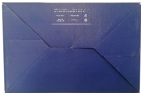
SCATOLA PER SCARPE SPARCO TEAMWORK in cartone. Carta velina interna protettiva. Dimensioni: 343x258x123mm