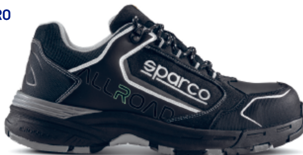
STIRIA ESD S3S SR FO HRO 07528tgNRNR

Scarpe antinfortunistiche conformi alla nuova norma EN ISO 20345:2022, realizzate in microfibra idrorepellente e collarino in nylon. Intersuola in Phylon con battistrada in gomma HRO FO CrossGrip. Leggere, sportive e resistenti, sono adatte sia per l'esterno che per l'interno.