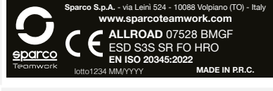
ETICHETTA "CE". stampata all'interno della linguetta Dimensioni 50 x 15 mm