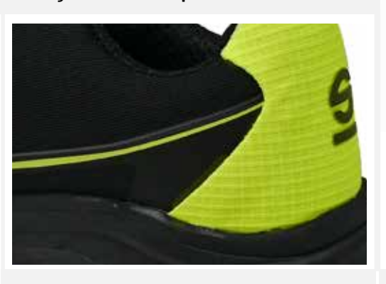
Costruzione totalmente SEAMLESS.