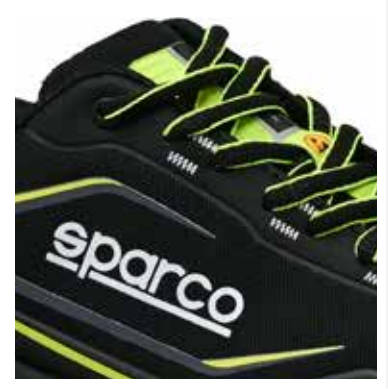
Logo TEAMWORK stampato sulla linguetta (15x60 mm) Logo ESD su passalacci.