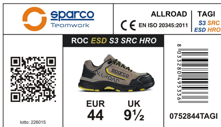
SCATOLA SCARPE SPARCO TEAMWORK in cartone blu-bianco-arancio e carta velina interna protettiva. Dimensioni 343x188x123 mm Indicazioni per il riciclo valide per l'ITALIA sul fondo (PAP20)