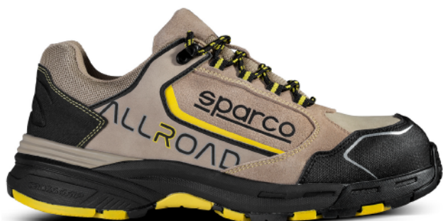
ROC ESD S3 SRC HRO 07528tgTAGI