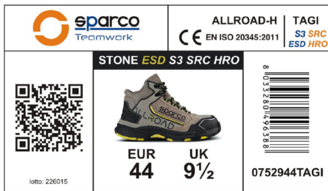
SCATOLA SCARPE SPARCO TEAMWORK in cartone blu-bianco-arancio e carta velina interna protettiva. Dimensioni 343x258x123 mm Indicazioni per il riciclo valide per l'ITALIA sul fondo (PAP20)