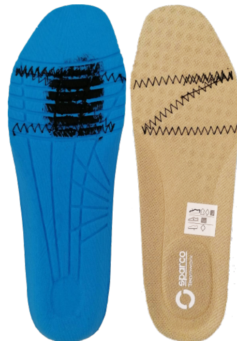
SOLETTA REMOVIBILE antistatica in morbido poliuretano con termoformatura ergonomica.