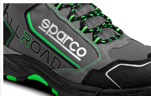
LOGHI e DECORAZIONI realizzati in serigrafia