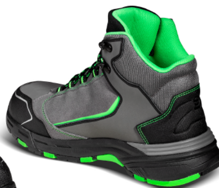
LEAP ESD S3 SRC HRO 07529tgGSVF