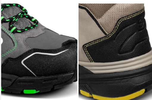
RINFORZO in microfibra anti-abrasione su punta e tallone con lavorazione 3D in alta frequenza.