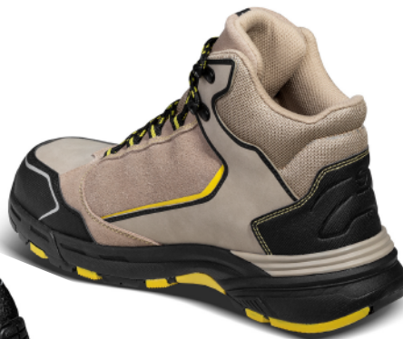
STONE ESD S3 SRC HRO 07529tgTAGI