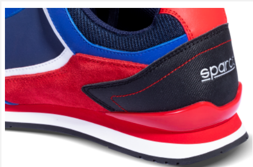
RINFORZO in TPU al tallone per una migliore stabilità e maggiore resistenza.