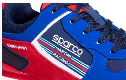
LOGHI e DECORAZIONI realizzati in microiniezione