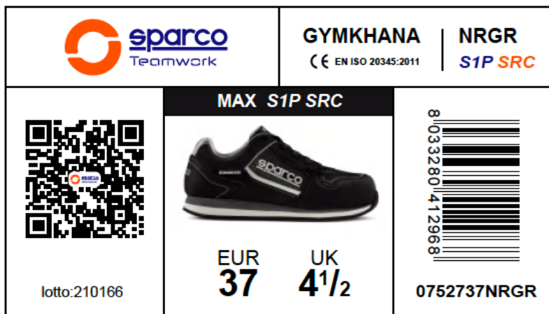
SCATOLA SCARPE SPARCO TEAMWORK in cartone blu-bianco-arancio e carta velina interna protettiva. Dimensioni 343x188x123 mm Indicazioni per il riciclo valide per l'ITALIA sul fondo (PAP20)