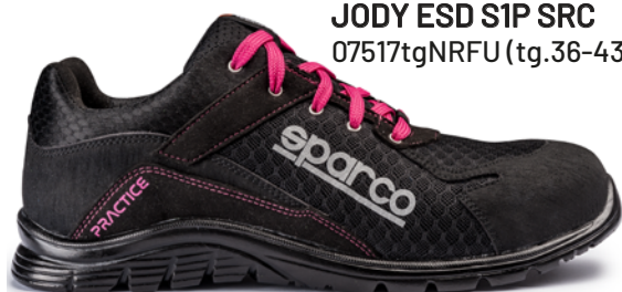
JODY ESD S1P SRC 07517tgNRFU (tg.36-43)