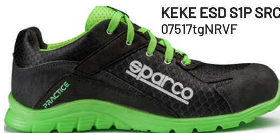
KEKE ESD S1P SRC 07517tgNRVF