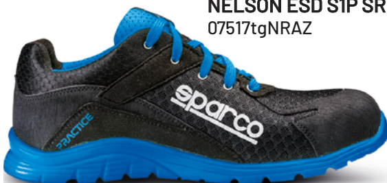
NELSON ESD S1P SRC 07517tgNRAZ