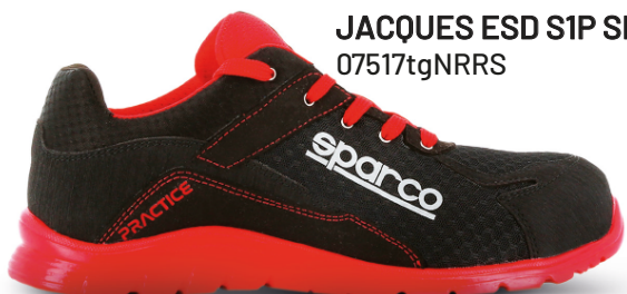
JACQUES ESD S1P SRC 07517tgNRRS