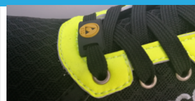
ETICHETTA ESD realizzata come passalacci gommato.