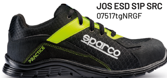
JOS ESD S1P SRC 07517tgNRGF